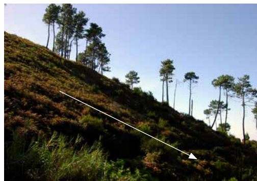
Der konventionale Code sagt uns bei diesem Bild: Es geht hier von links oben nach rechts unten. Die Linienführung ist fallend, es wirkt eine Abwärtsbewegung.