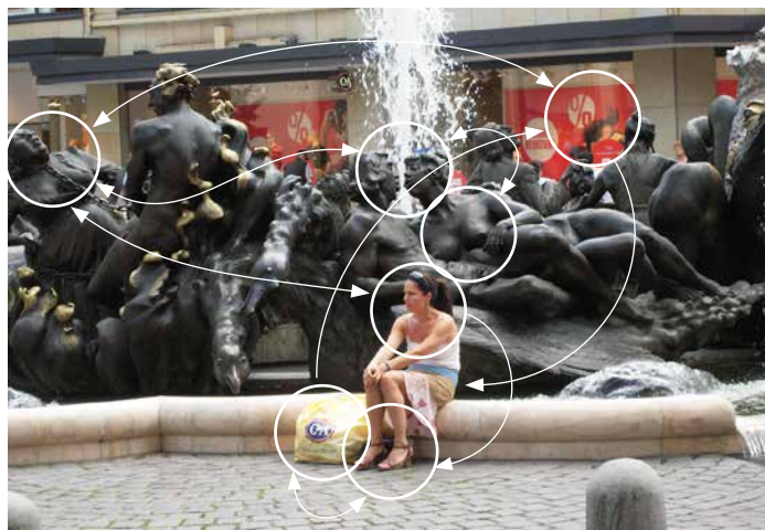
Bei der aufmerksamen Verarbeitung springt das Auge sakkadenartig über das Bild und entschlüsselt die Einzelheiten, die eine Interpretation möglich machen.