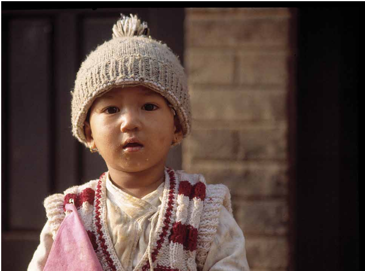
Bilder mit Kindergesichtern, insbesondere aus der dritten Welt, werden gezielt eingesetzt, um Gefühle zu erwecken.

sich mit Bildern beschäftigen, und das sind heute praktisch alle. Bilder funktionieren anders als Text. Sie erreichen uns in Millisekunden, berühren uns oder lassen uns kalt. Bilder bedürfen keiner Sprache, sie funktionieren auf der ganzen Welt. Den Text müssen wir uns kulturell aneignen, es ist eine spezielle Zeichensprache notwendig, die an der eigenen Sprachgrenze aufhört zu existieren. Je nach Sprachkompetenz werden Texte mehr oder weniger verstanden. Auch Zeichen Musik oder Träume vermögen starke Bilder zu erzeugen. Beim Lesen dauert der Vorgang des Erkennens viel länger als beim Bild.