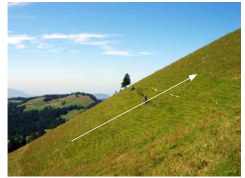
Aus dem gleichem Grund ist hier die Linienführung steigend, hier ist eine Aufwärtsbewegung sichtbar. Es ist mit einem steigenden Liniendiagramm zu vergleichen.