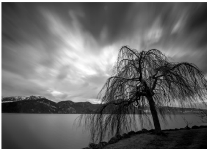
Die Originalaufnahme, 92 mm breit. Ein allfälliger Kompressionsverlust ist durch die Verkleinerung des Vollformat-Originalbildes kein Thema.