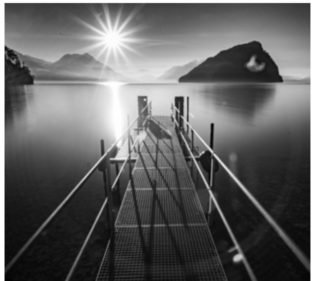
Der Verkleinerungsfaktor einer 20-Megapixel-Datei auf 80 mm Breite in 300 ppi führt zu einem Pixelverlust von über 90%.

JPEG unterstützt 8 Bit (16,7 Millionen Farben), nimmt Metadaten mit, unterstützt aber keine Transparenz. Im